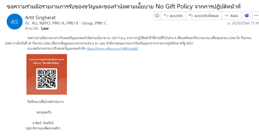
(ตัวอย่างภาพประกอบ Microsoft Form แบบฟอร์มรายงานผลตามนโยบาย No Gift Policy)

๒.๔ รูปแบบดำเนินการ: วันที่ ๒๖ กันยายน ๒๕๖๖ ประชาสัมพันธ์ผ่าน E-mail ให้กับผู้บริหาร เจ้าหน้าที่ และพนักงานของ สอวช. ทุกคนรับทราบ และตอบแบบสำรวจออนไลน์รายงานผลการดำเนินงานด้านการขับเคลื่อนนโยบาย No Gift Policy จากการปฏิบัติหน้าที่ ปิงปประมาณ พ.ศ. ๒๕๖๖ (รอบ ๑๒ เดือน) แบบสำรวจออนไลน์ Microsoft Form แบบรายงานผลตามนโยบาย No Gift Policy